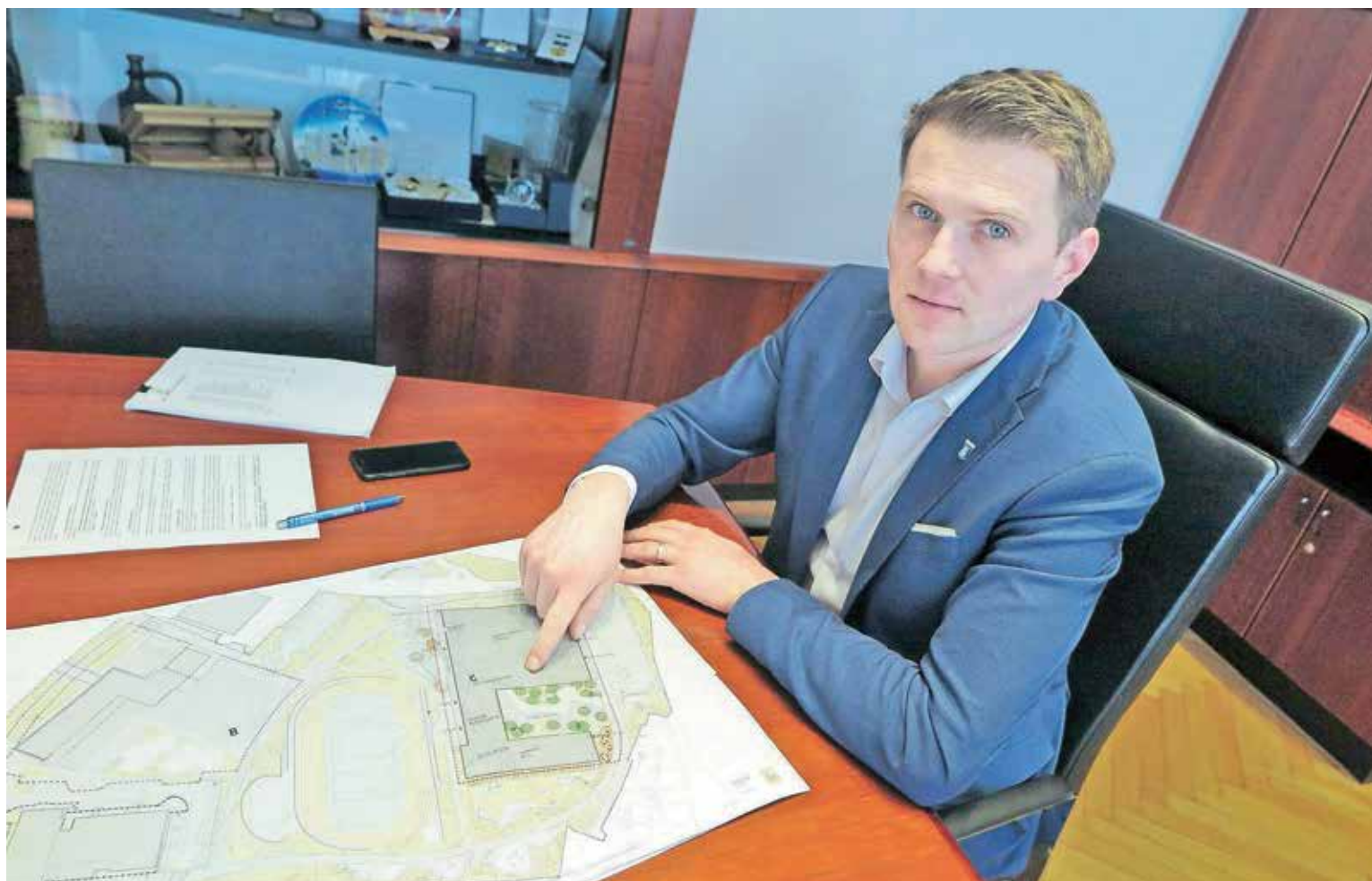
Župan s projektom nove Osnovne šole Frana Albrehta in športne dvorane, ki v tem mandatu ostaja prioriteta.

»To ne drži. Glede na to, da gradbeno dovoljenje še ni izdano (po dostopnih informacijah pa naj bi bil tik pred izdajo), je nerealno pričakovati, da bi se gradnja šole začela letos, zato bomo v letošnjem proračunu kar se da največ sredstev namenili v sklad. Ko bomo gradbeno dovoljenje prejeli, bomo na seji občinskega sveta obravnavali idejne in investicijske projekte. Do sedaj Občinski svet zadeve še ni obravnaval. Takrat bo odprta javna razprava, vsak bo lahko povedal svoje mnenje, na podlagi tega bomo projekte potrdili in se lotili izbire izvajalca. A vse to bo možno izpeljati do konca letošnjega leta, kar pomeni, da bomo z gradnjo lahko začeli šele prihodnje leto. Tudi recenzije je še treba opraviti, da bomo prišli do realne cene, ne vidim razloga, zakaj bi bila ta šola na kvadratni