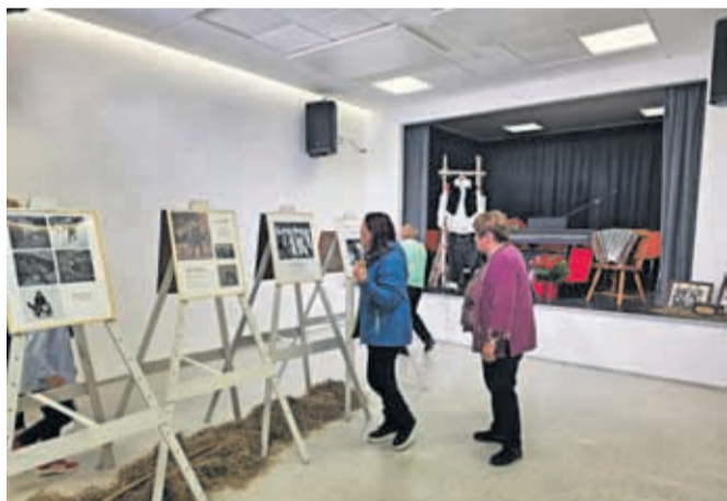
Dvorana je ob odprtju gostila že prvi dogodek, razstavo v spomin Rudiju Poljanšku.

teles (IR-paneli), dobavljena so bila vsa notranja vrata, izvedene vse notranje finalne obloge, lesen podest za izvedbo dodatnega prostora za skladiščenje, vsa slikopleskarska dela, dobavljen je bil nov lesen montažni gledališki oder, nova je keramična talna obloga na zunanjem stopnišču, izvedli so oplesk obstoječe ograje ter slikopleskarsko osvežitev celotnega stopnišča in predverja. Postavili so tudi suhomontažno steno z vrati, ki prepreči prehod v klet. »Za vsa izvedena dela je Občina Kamnik v letih 2020–2025 namenila slabih 137.000 evrov, dela se bodo še nadaljevala. V letu 2026 je namenjenih 20.000 evrov sredstev,« so ob tem povedali na Občini Kamnik.