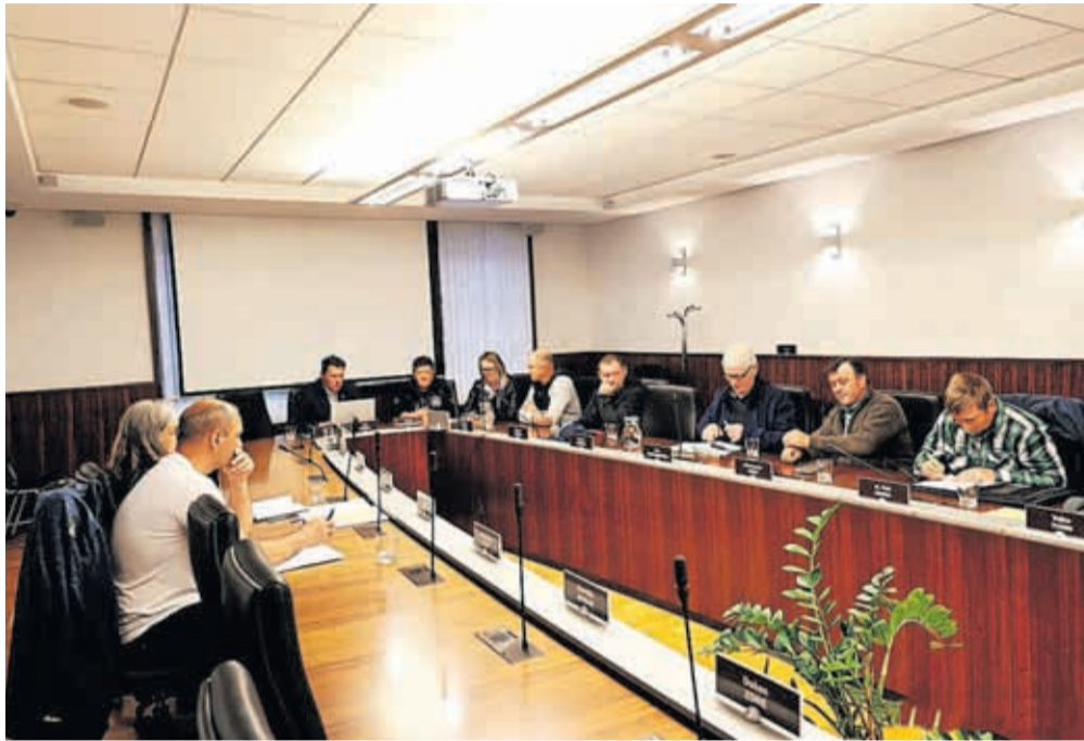
Srečanje je bilo namenjeno pogovoru o ključnih izzivih in razvojnih usmeritvah kmetijstva v občini Kamnik.

Poudarili so tudi pomen rednega vzdrževanja gozdnih cest ter pobudo za uvedbo subvencionirane mesečne