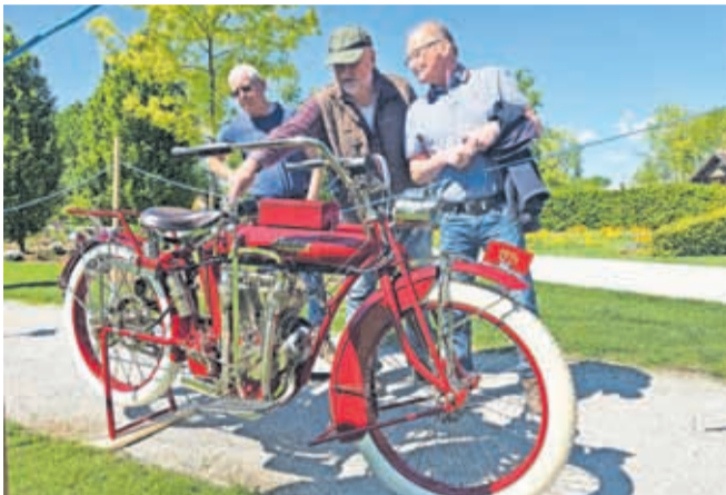
Najstarejši med vozili je bil motor Indian Big Twin Hedstrom iz leta 1914 v povsem originalnem stanju.