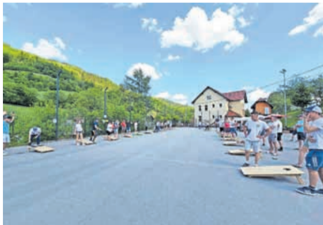
Prvo tekmovanje dvojic v štrbunku na tuhinjskem igrišču je več kot uspelo.