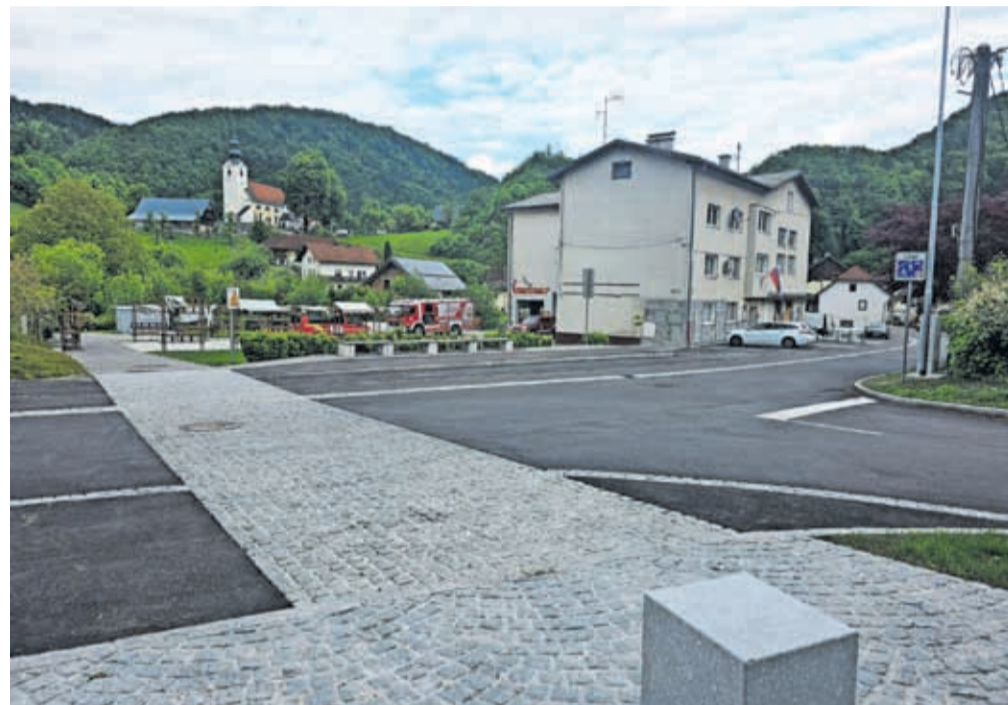
Središče Motnika v prenovljeni podobi / FOTO: ŠPELA ŠIMENC

Trenutno je mala komunalna čistilna naprava v poskusnem obratovanju (nanjo je priklopljenih petdeset objektov), ko bo ta faza zaključena in bo pridobljeno uporabno dovoljenje (pogodbeni rok za pridobitev uporabnega dovoljenja in primopredajo objekta je 12. junij 2026), pa bo najverjetneje njen stalni upravljavec Javno podjetje Centralna čistilna naprava Domžale - Kamnik (o tem so