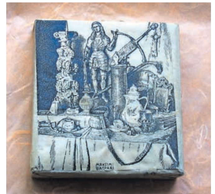
Klišeev ovitku za natis razglednice Maksima Gasparija z motivom iz Sadnikarjeve muzejske zbirke, trideseta leta 20. stoletja / FOTO: HRANI MEDOBČINSKI MUZEJ KAMNIK

Oglas v Kamničanki leta 1906 / FOTO: HRANI MEDOBČINSKI MUZEJ KAMNIK