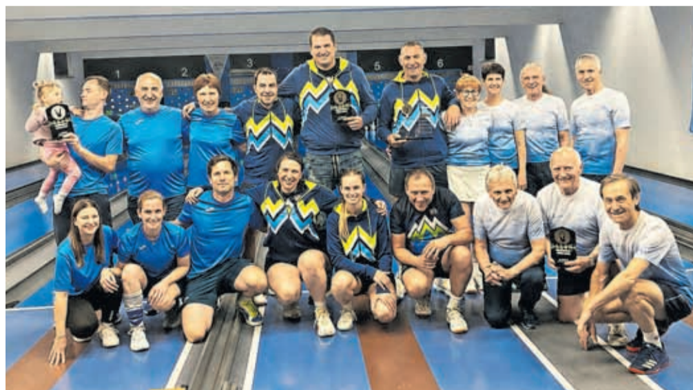
Zmagovalci Občinske trim lige

Tudi v tej sezoni smo na našem kegljišču spremljali Občinsko trim ligo. V štirikrožnem sistemu je tekmovalo ekip, tako da je vsaka odigrala 16 tekem. Daleč naj-