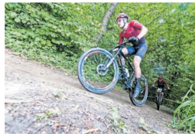
Calcit Bike Team je v mesto pripeljal dvodnevni kolesarski spektakel.