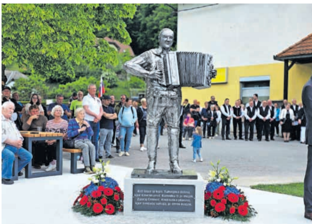
Skulpturo je izdelal Alojz Burja.

Projekt je potekal pod pokroviteljstvom Občine Kamnik,