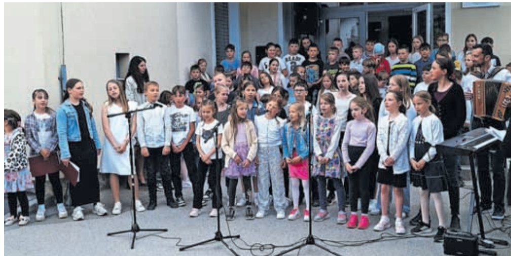
Prireditev Vseslovensko petje s srci je potekala že četrto leto zapored.

Na odru so se zvrstili najmlajši iz vrtca, njihove vzgojiteljice,