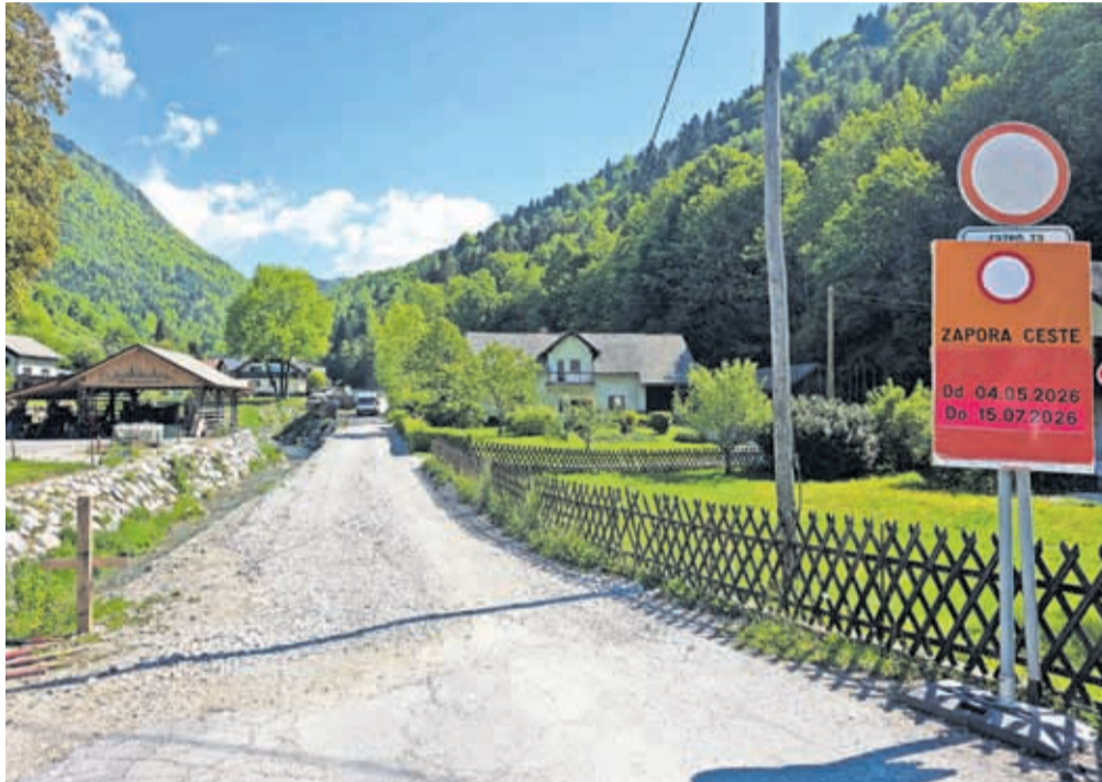
Država je občini po dolgi usklajevanji odobrila sredstva za sanacijo cestnišča skozi vas nazaj v asfaltirano stanje.

Država je občini po dolgi usklajevanji z ministrstvom za naravne vire in prostor odobrila sredstva za sanacijo cestnišča skozi vas nazaj v asfaltirano stanje. V tem cestnišču je tudi vaški vodovodni sistem, ki ga bo po besedah župana treba obnoviti, prav tako bo treba območje opremiti s kanalizacijo. Z namenom celostne ureditve območja cestnišča je tako pred asfaltiranjem cestnišča predvidena vgradnja