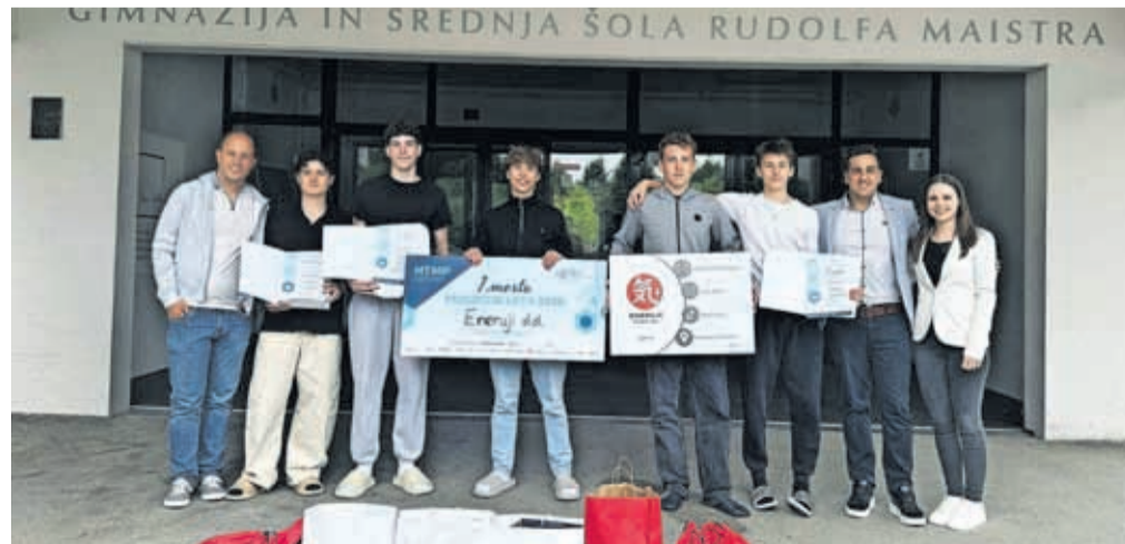
Z dijaškim podjetjem Eneruji, d. d., so kamniški dijaki osvojili prvo mesto v državi.

Gre za enega največjih dosežkov na področju mladinskega podjetništva, saj bodo kamniški dijaki svoje znanje,