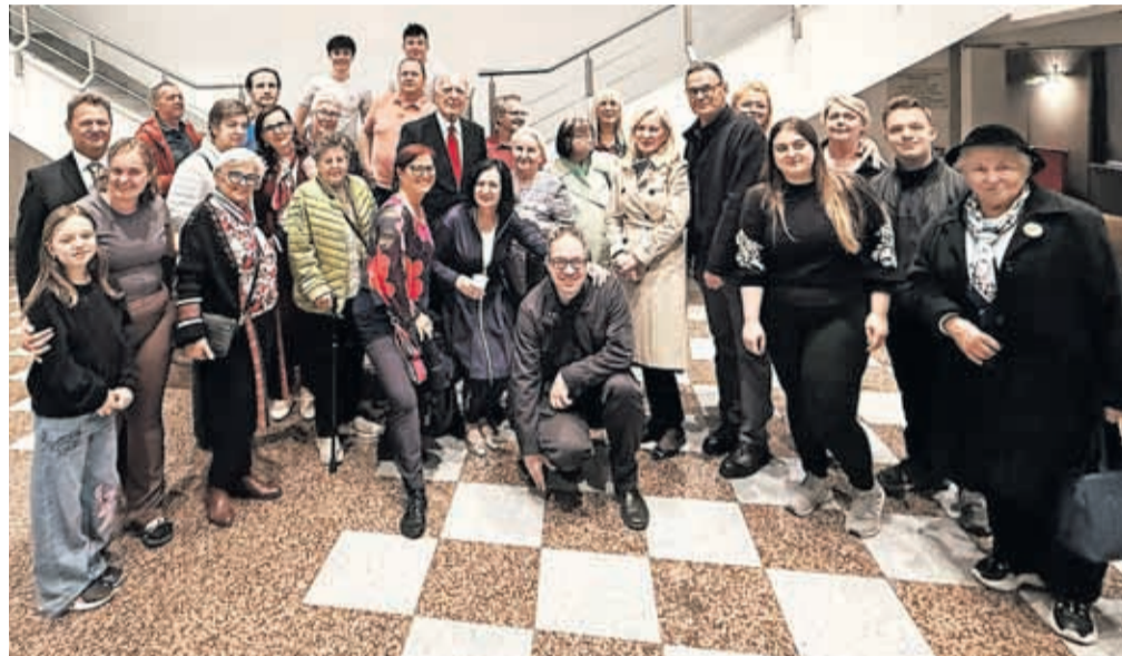
Prva ideja o gostovanju v Sarajevu se je med člani obeh društev rodila že junija 2025.

Prva ideja o gostovanju v Sarajevu se je med člani obeh društev rodila že junija 2025, ko so člani dramske skupine med poletno ekskurzijo po Bosni obiskali tudi Slovensko društvo Cankar. Ker gre za razmeroma oddaljeno destinacijo, je bilo treba pridobiti finančna sredstva, zato se je ŠKD Mekinje s projektom Naš jezik, naš smeh: slovenska komedija za slovensko skupnost v Sarajevu uspešno prijavilo na javni razpis Ura da vlade Republike Slovenije za Slovence v zamejstvu in po svetu. Pomen projekta je prepoznala in finančno podprla tudi Občina Kamnik. Zjutraj na dan predstave so bili člani dramske skupine vabljeni na sedež Slovenskega društva Cankar, kjer je ob skupnem zajtrku potekalo