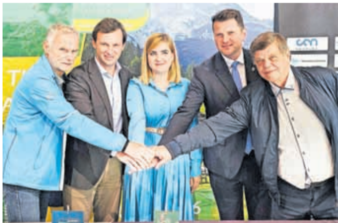
Organizatorji so pripravljene na enega večjih športnih dogodkov pri nas.

Snovik – V Termah Snovik so organizatorji evropskega prvenstva v gorskih in trail tekih (Atletska zveza Slovenije, Občina Kamnik in Klub gorskih tekačev Papež) pripravili novinarsko konferenco, na kateri so predstavili podrobnosti tekmovanja. Čeprav je Kamnik gostil že svetovno prvenstvo v gorskih tekih 2010 in evropsko prvenstvo sedem let kasneje, je tokratno prvenstvo vendarle malo posebno. Potekalo bo kar tri dni, prvič pa bo omogočeno, da bodo skupaj z elitnimi tekmovalci tekli tudi rekreativci. V Kamnik prihaja več kot 600 tekačev in več kot 200 njihovih spremljevalcev iz 33 evropskih držav. Uradno odprtje tekmovanja bo na Glavnem trgu v središču Kamnika v četrtek, 4. junija, popoldne. V petek je na