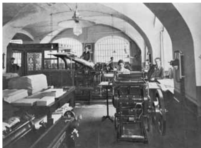
Slatnarjeva tiskarna med obema vojnama

mniško kulturno, politično in založniško življenje prve polovice 20. stoletja ter ostaja pomemben del njegove dediščine.