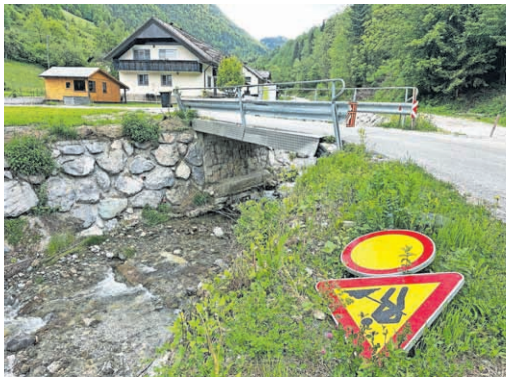
Aprila se je iztek el razpis za izbor izvajalca gradbenih del za sanacijo v poplavah poškodovanega mostu, ki povezuje vas Krivčevo in Kranjski Rak.

Sanacija mostu na območju naselja Krivčevo, ki je, kot zapisano, v fazi izbire izvajalca in usklajevanja z ministrstvom za naravne vire in prostor, predvideva izvedbo nove mostne konstrukcije za premostitev pritoka potoka Volovljek. To bo armirano-betonski okvirni premostitveni objekt na javni poti 661191, severovzhodno od vasi Krivčevo. Premostitveni objekt sestavljata po dva opornika, ki sta podporna zidova debeline 40 cm, in prekladna konstrukcija iz AB plošče debeline 40 cm z robnimi venci višine 75 cm nad vrhom AB plošče. V času gradnje bo skladno z elaboratom cestne zapore oziroma ustrezno dokumentacijo za izvedbo potrebnih zapor skrbel izvajalec del, prebivalci tega območja bodo o tem pravočasno obveščeni. Podpis pogodbe oziroma izvedba del se predvideva v letu 2026.