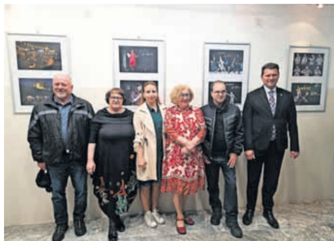
Na odprtju razstave, ki je uvod v pestro festivalsko dogajanje

Tudi letos med 12. in 14. junijem pripravljajo pester program, v središču katerega bo kot vedno – pripovedo-