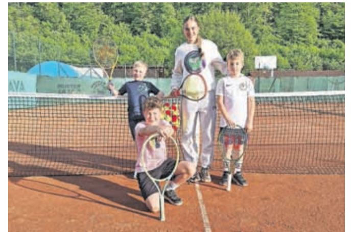
Najmlajši člani kluba so v maju prvič stopili na peščena teniška igrišča.

okriljem Teniške zveze Slovenije. Tekmeci Kamničanov bodo v juniju najprej člani Sladkega Vrha iz Sentilja ter nato še obe elitni mariborski posadki (ŽTK in Branik). Ob najboljših in najmlajših pa loparje na šestih igriščih vneto vihtijo tudi številni rekreativci. Če bi se jim želeli pridružiti, imate konec meseca edinstveno priložnost. Od 26. do 29. maja bo namreč na igriščih kamniškega teniškega kluba Pod Skalo potekal brezplačni tečaj za odrasle začetnike.