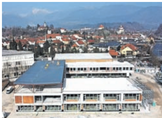
Osnovna šola Frana Albrehta Kamnik

Izgradnja šole je največji investicijski podvig Občine Kamnik v tem desetletju, pa tu ne mislimo le v finančnem smislu. Skoraj 15-letni projekt, za katerega so bila izdana tri gradbena dovoljenja in izvedeno nekaj prilagoditev projektov, počasi dobiva svojo podobo. Nova Osnovna šola Frana Albrehta bo sestavljena iz treh lamel, in sicer lamel A, B in C. Izvajalec je začel izkop na lameli C, nadaljeval na lameli A in nato še na lameli B. Lameli C in A sta zidani, pod lamelo A, ki je tik ob športni dvorani, je zgrajeno tudi dvonamensko zaklonišče, lamela B pa je zgrajena iz jeklene mostne konstrukcije. Nova šola z izgradnjo strehe nad jekleno konstrukcijo lamele B že