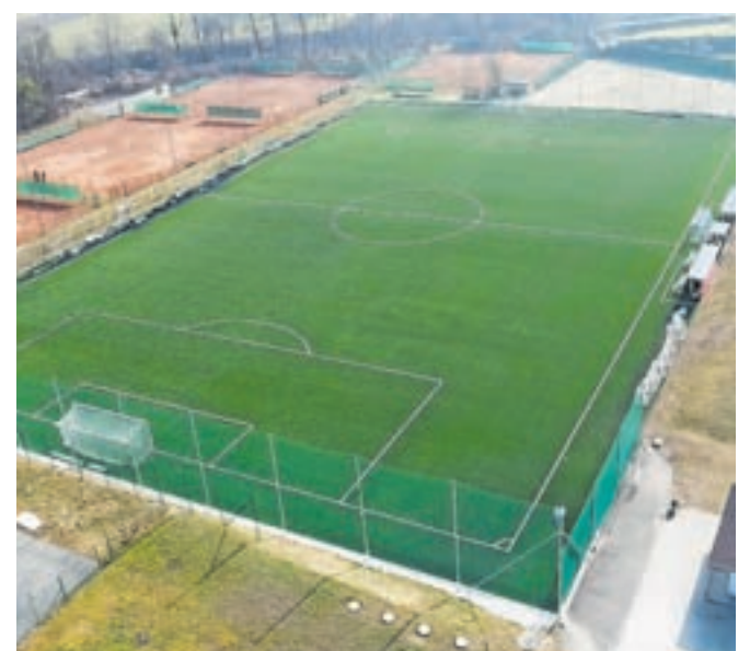
Prenova športnega parka Virtus

Občina Kamnik je v lanskem letu posebno pozornost namenila urejanju športne infrastrukture, pri čemer je zagotovo ena pomembnejših investicij prenova športnega parka Virtus. Celotna prenova je razdeljena na več faz, od katerih je prva in verjetno tudi najdlje pričakovana ureditev velikega nogometnega igrišča v igrišče z umetno travo. Jeseni je bila pripravljena projektna dokumentacija za izvedbo del – PZI, na podlagi katere je bil v februarju izveden javni razpis za izbor izvajalca gradbeno-obrtniških del. V začetku aprila pa so na gradbišču zabrneli gradbeni stroji ter začeli dela prenove velikega nogometnega igrišča. Projekt prenove športnega parka Virtus – Ureditev velikega nogometnega igrišča z umetno travo smo prijaviili na razpis Fundacije za šport RS in razpis Nogometne zveze Slovenije. S projektom smo bili na obeh razpisih uspešni, in sicer smo bili v okviru Fundacije za šport opravičeni do 45.210 evrov, s strani Nogometne zveze Slovenije pa je bil projekt podprt v višini 40.000 evrov. Celotna vrednost investicije je znaša-