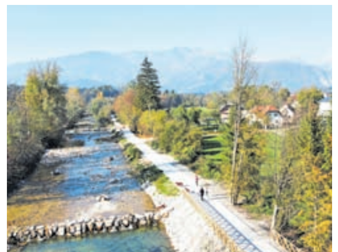
Kolesarska povezava Kamnik–Godič

mi in lesenimi igrali, ponekod so postavljena tudi stojala za kolesa. Urejena je tudi Kolesarčkova učna pot, ki vse obiskovalce seznanja z vsebinami o naravni, kulturni in drugi dediščini s tega območja. Kolesarska pot bo predstavljala nadaljevanje zelene osi ob Kam-