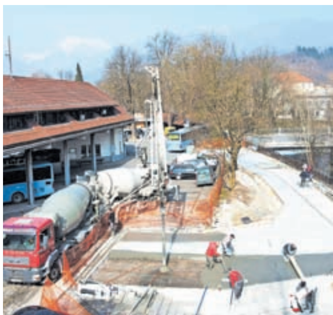
Ureditev trga pri glavni avtobusni postaji Kamnik in postavitve skulpture mamuta